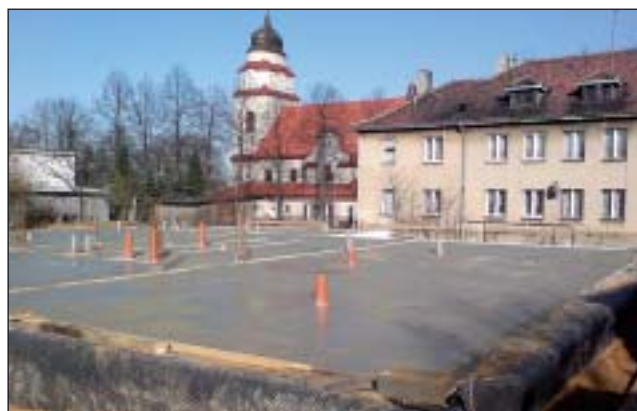
Trwa budowa nowej Przychodni Zdrowia w Wyrach – czyt. na str. 11.